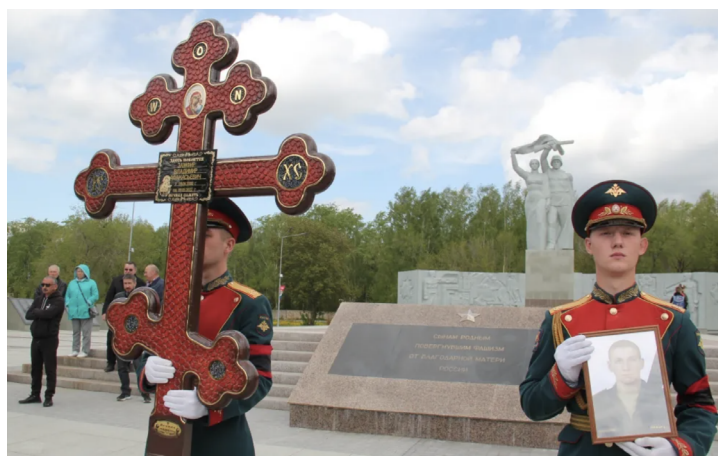
Фото 1, 2. Визуальный ряд из некрологов [Приложение 1. Некрологи 26, 31]

В целом в некрологах мы обнаруживаем попытку дифференциации и углубления образа погибшего через многоуровневое повествование и наслоение привлеченных типов идентичности. Однако, как будет показано далее, степень дифференциации и расставление акцентов в репрезентации образа погибшего имеют значительные различия в разных источниках.