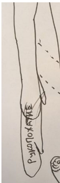
Рисунок 1. Символ мужского единства. Информант № 3

соотнесения себя с другими мужчинами, а также готовность идти на жертвы ради них, так как мужчина всегда готов к акту — на самом деле эгоцентричному — «героического жертвования» ради другого [Holt, Thompson, 2004]. Именно эта оглядка на сообщество, члены которого, «как и все остальные», идут в армию, становятся добровольцами и испытывают себя, обязывает прикладывать усилия к тому, чтобы стоять с членами этого сообщества в одном ряду. Об этом говорит и использование визуальных образов: в рамках одной из проведенных сессий телесного картирования участник исследования особо выделил правую руку как символ этого единства, а другой участник в качестве девиза своей идентичности выбрал фразу «своих не бросаем».