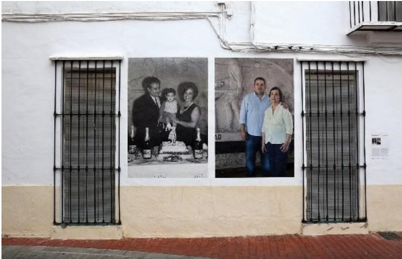
Фото 3.

Как пишет С. Ван Дембрук, позирование родственников пропавших без вести имеет характер, отличный от постановки обычных семейных фотографий, позирование для этого проекта было частью политической активности участников по осуждению произвола властей [Van Dembroucke, 2010: 8]. Таким образом, акт рефотografiрования приобретает характер политического высказывания.