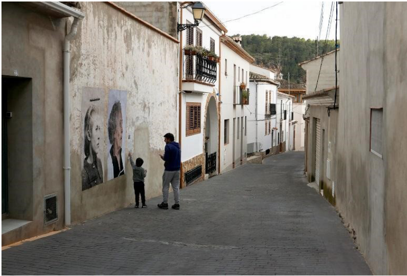
Фото 6. 14

непрост с этической точки зрения. Из интервью с Джермано Ван Дембрук извлекает этико-биографическое объяснение этой коллизии: «Тот факт, что я сам пережил потерю кого-то из членов моей семьи из-за этих же преступлений, позволил мне установить более тесные отношения с этими людьми, потому что между нами существует общее братство» [Van Dembroucke, 2010: 18–19]. Очевидно, мандат на преодоление этических препятствий Джермано получил, разделяя общие утраты и ценности той социальной группы, которая несла потери во время военной диктатуры.