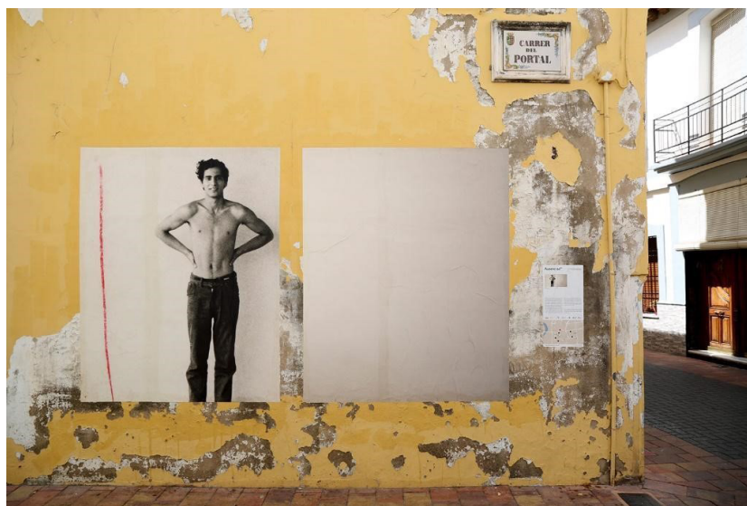
Фото 5. Источник: проект «Отсутствие» в проекте «Городские инсталляции» 13

Другой заметный актер рефотографии — темпоральность. Она заявляет о себе связью прошлого, когда были живы близкие, и настоящего, в котором им отведено место, не занятое никем, что подчеркивает незаменимость человека, невозможность утраты. Этот эффект торжествующей темпоральности усилен неоднократно благодаря коллекции четырнадцати пар снимков в фотопроекте Джермано, что придает индивидуальной или семейной потере характер коллективной национальной утраты. Но равным образом обнаруживается и сильный жест культурного сопротивления этой темпоральности — общая решимость помнить о травме как коллаборация носителей утраты и тех, у кого есть власть репрезентации. Ведь рефотография предъявлена в публичном контексте галереи и за ее пределами — на стенах домов, растиражирована в медиа.