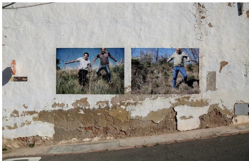
Фото 4. Источник: проект «Отсутствие» в проекте «Городские инсталляции» 12

Рефотографии, безусловно, имеют более профессиональный характер, они выстроены с точки зрения композиции, освещения, очевиден контраст с семейной фотосъемкой, фотографии исходных версий несут печать времени. Но прежде всего рефотографии проекта «Отсутствие» обнаруживают контрасты выражений лица и направленности взглядов. Позируя для рефотографии, персонажи уже не могут позволить себе не обращать внимания на камеру. Позирование теперь приобретает характер социального взаимодействия, усиливаемый взглядом субъекта фотографии. Фотографируемые знают, какая история стоит за предложением воспроизвести позу, ради каких целей осуществляется повторная съемка. Тем не менее на ряде рефотографий Джермано экспериментирует с инсценируемой спонтанностью, например, на фото 5 немолодой мужчина, уже один, без брата, с видимым усилием сбегает с насыпи, его взгляд устремлен под ноги. Если движение еще возможно реплицировать, то настроение, веселый взгляд братьев в объектив десятилетия назад не подлежат воспроизводству, между этими снимками стоит прожитое, знание о семейной и национальной трагедии и потере, смысл которых отфильтровывают уместные эмоции.