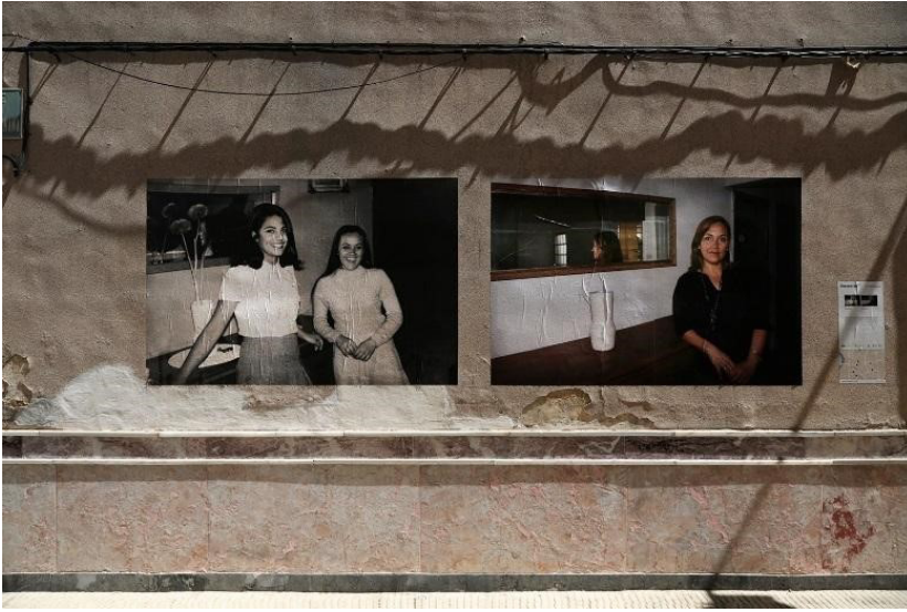
Фото 2. Источник: проект «Отсутствие» в проекте «Городские инсталляции» 10

Как пишет С. Ван Дембрук, позирование родственников пропавших без вести имеет характер, отличный от постановки обычных семейных фотографий, позирование для этого проекта было частью политической активности участников по осуждению произвола властей [Van Dembroucke, 2010: 8]. Таким образом, акт рефотografiрования приобретает характер политического высказывания.