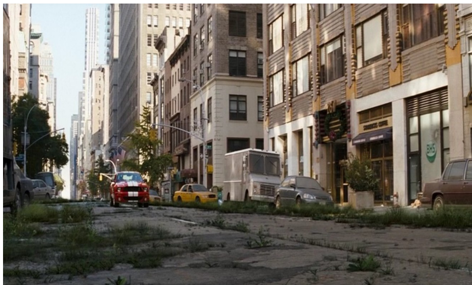
Рисунок 6. Скриншот