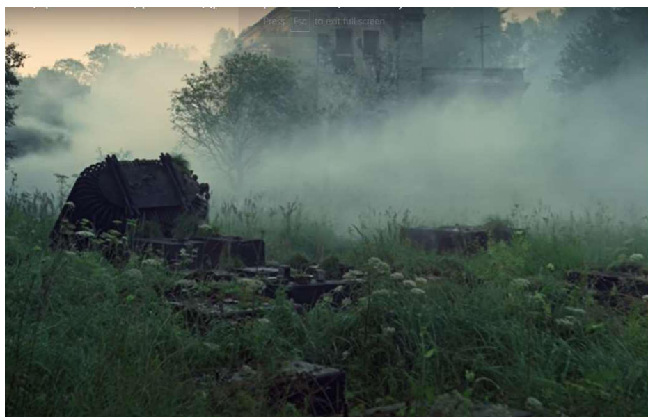
Рисунок 4. Скриншот

В итоге неопределенное пространство деиндустриализированных объектов «определяется» шаблонно, на основе ряда иконографических элементов. Фотограф-любитель создает сообщение о заброшенном пространстве в соответствии с устоявшейся визуальной грамматикой, на которую повлияли популярные произведения о посткатастрофических мирах. Пример широко известной в постсоветских странах игры S.T.A.L.K.E.R. хорошо демонстрирует закономерности современной конвергентной культуры: фанатские видео, снятые в «заброшках», ссылаются на локации игры (рис. 5).