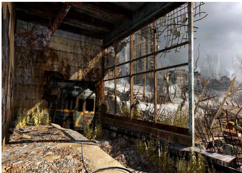
Рисунок 5. Скриншот