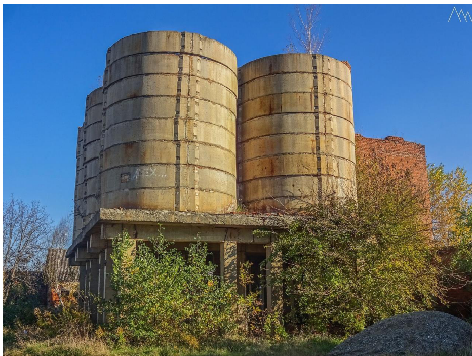
Рисунок 3. Фотография деиндустриального места и природы 2

Сегодня в популярной культуре циркулируют как позитивные, так и негативные образы «дикой природы». Позитивный образ в значительной степени связан с эпохой романтизма рубежа XVIII–XIX веков, идеализировавшей естественные стихии, на которые тогда только началось воздействие производственной деятельности человека индустриальной эпохи. Между тем образ природы в качестве опасного «инога» архетипически укоренен в культуре человечества и проявляется в разные периоды в элементах картины мира. Вспомним, например, фольклорные мотивы дикого леса — если не как источника страха, то как зоны иночеловеческого. Столь понятные нам экологические идеи заботы и охраны, а не противостояния, стали продолжением современных представлений о природе «как мастерской»: стихия расколдована и требует ответственного отношения к себе. Наконец, в литературной и кинофантастике, откликающейся на философские повороты, в частности на обсуждаемый в наши дни онтологический поворот, создаются агенты, обладающие «чужой феноменологией». Иногда это могут быть расы разумных растений, например триффиды из романа и фильмов «День триффидов». Нам представляется важным влияние популярной культуры на то, что альтернативность заброшенных мест показывается как мир за пределами мира людей через фотографическое наблюдение за агентностью растений.