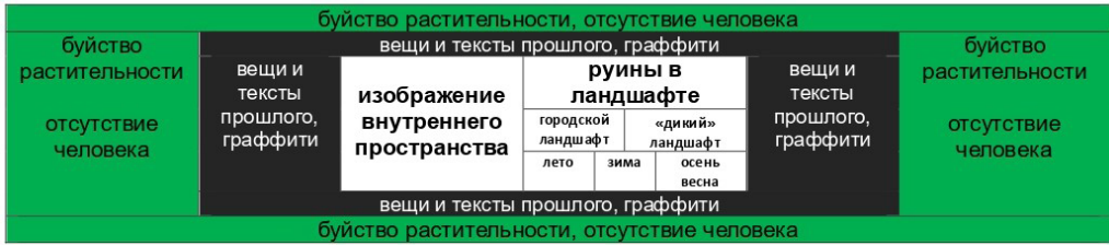
Рисунок 1. Схема изобразительных мотивов и элементов, типичных для фотографий заброшенных пространств

Схема направляет наши выводы. Во-первых, для фоторепрезентаций «заброшки» характерна статичная композиция с преобладанием вертикальных и горизонтальных линий у объектов в кадре. Во-вторых, рамочная структура схемы передает сочетание общих и частных изобразительных мотивов и элементов, которые включают фотографии «заброшки». Соответственно, исследователи (и мы в том числе) сначала наблюдают, фиксируют и классифицируют то, что изображено. Затем зафиксированное описывается с учетом исторических «корней» и особенностей бытования изображений в культуре, это и есть этап иконографии. После чего решается задача иконологического заключения, представляющего выводы о передаваемых изображениями смыслах и о циркуляции этих смыслов.