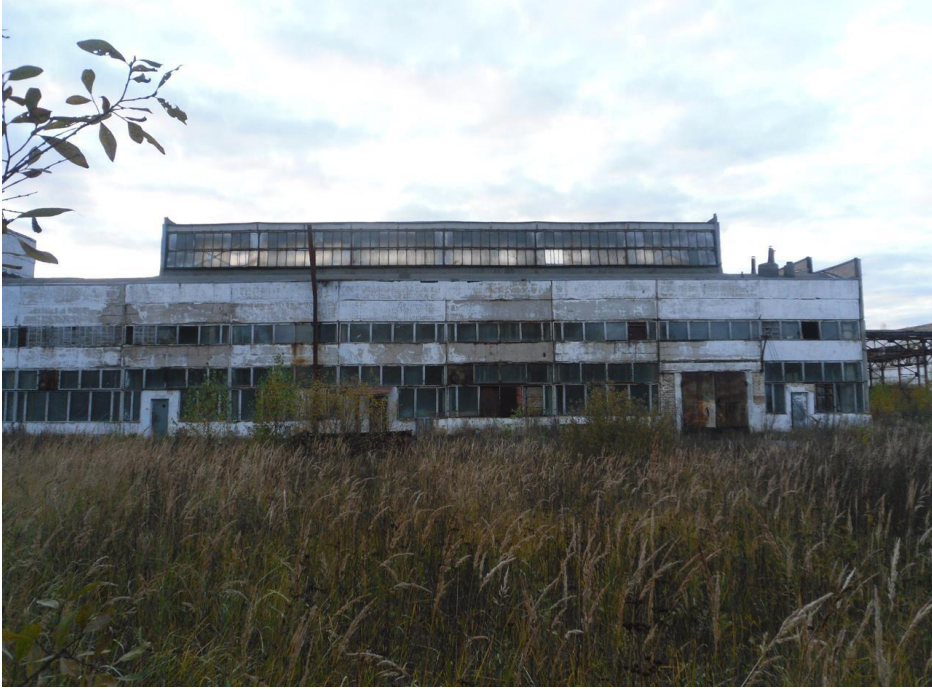
Рисунок 2. Фотография заброшенного пространства без человека 1

как действие, а наталкивают на размышления о пространствах, где жизнь разворачивалась. Из этого наблюдения следов и последствий возникают маргинальные эстетика и поэтика, намекающие на потенциальную красоту самых неожиданных мест.