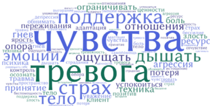
Рисунок 1. Словарь терапевтического дискурса в кризисных условиях

На Рисунке 1 приведена визуализация терапевтического дискурса в виде «облака слов»: составляющие дискурс словоформы представлены в текстах психологов, размер шрифта указывает на частоту упоминания. Визуализация позволяет зафиксировать акценты в дискурсе — на чувствах, тревоге, страхе и успокаивающих техниках дыхания. Предполагаем, что данные акценты свидетельствуют об актуальном переживании кризисности, представляет интерес и дальнейшее изучение темы с сопоставлением до- и посткризисных акцентов в текстах психологов.