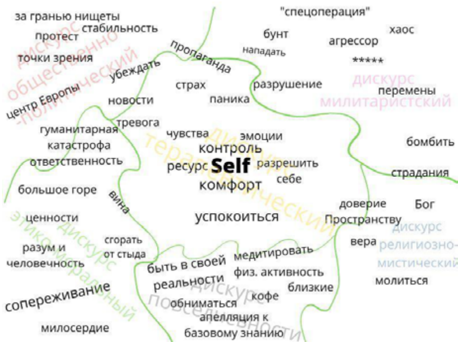
Рисунок 2. Терапевтический дискурс. Интердискурсивность

Психологи тоже подвержены возникшим кризисным условиям, прибегают к смешению дискурсов в своих текстах, размещенных в медиа. Не представляется возможным выявить, намеренно ли это смешение, однако оно, в свою очередь, характеризует кризисную ситуацию, которая как таковая способствует нарушению границ, правил, жанров 1 .