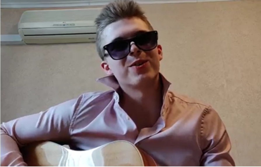
Рисунок 3. Фото исполнителя песни.

цитаты из интервью информантов, например, несколько интерпретаций того, что такое ментальная измена. Часть респондентов ответила, что даже просмотр откровенных фото актеров и актрис в интернете в тот момент, когда смотрящий находится в романтических отношениях с кем-либо, — ментальная измена, и такое недопустимо. Песня демонстрировала разные подходы и взгляды на этот феномен с помощью креативной подачи. Выступление произвело фурор.