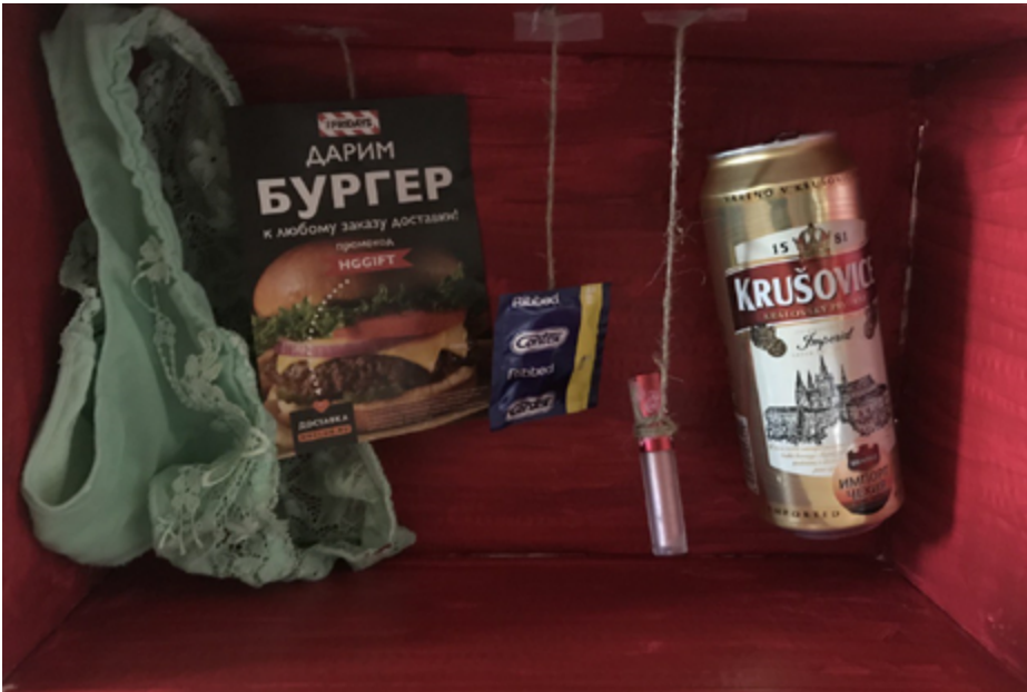
Рисунок 1. Инсталляция.

Была проведена серия интервью с молодыми людьми, которые были определенным образом вовлечены в тему исследования. Сами студенты относились к этому явлению по-разному. Кто-то полностью отрицал его, кто-то высказывал терпимое отношение. Были и такие, кто не видел в нем ничего плохого. Девушка, которая провела интервью и подготовила инсталляцию (рис. 1) и перформанс (рис. 2), высказывалась негативно об этом явлении. Тем не менее она постаралась подойти к анализу объективно. И в результате принесла на заключительное занятие специально выкрашенную в красный цвет коробку, в которой метафорично были собраны предметы, олицетворяющие «секс без обязательств». В коробке находились: флаеры из ночных клубов, подвешенная губная помада, женские трусы, банка пива и презерватив.