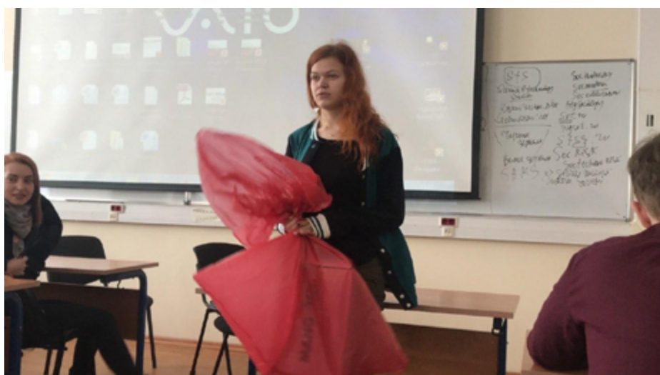
Рисунок 2. Перформанс. Секс без обязательств.

должен рассказать, какую идею он хочет донести до зрителя, и затем посредством метафорических приемов произвести некое действие. Впоследствии студентка сказала, что внимательно изучила интервью и хочет продемонстрировать, как одна часть опрошенных относится к самому явлению секса без каких-либо обязательств. Тут же она озвучила и свое субъективное мнение, что сама она негативно относится к сексу без обязательств, однако понимает, что есть люди, которые вполне нейтрально относятся к этому явлению, и она их не осуждает. Затем она произнесла: «Итак, вы видели вначале мою инсталляцию, которая олицетворяет это явление. А сейчас я вам покажу перформанс» . После этого она достала большой мусорный мешок, и все то, что было красочно оформлено, демонстративно и эффектно отправила в корзину для мусора. Надо сказать, что студенты оценили такой концептуальный, нестандартный подход достаточно высоко.