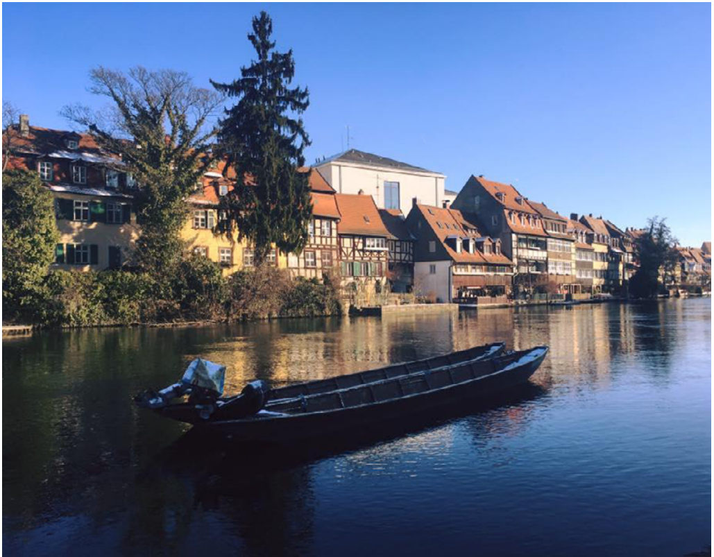
Fig. 1. Historic city center of Bamberg.

We look what are the important dates. Next year there is the date of 500 years, no 700 years of the Bavarian law for making beer. Yeah, It's a great