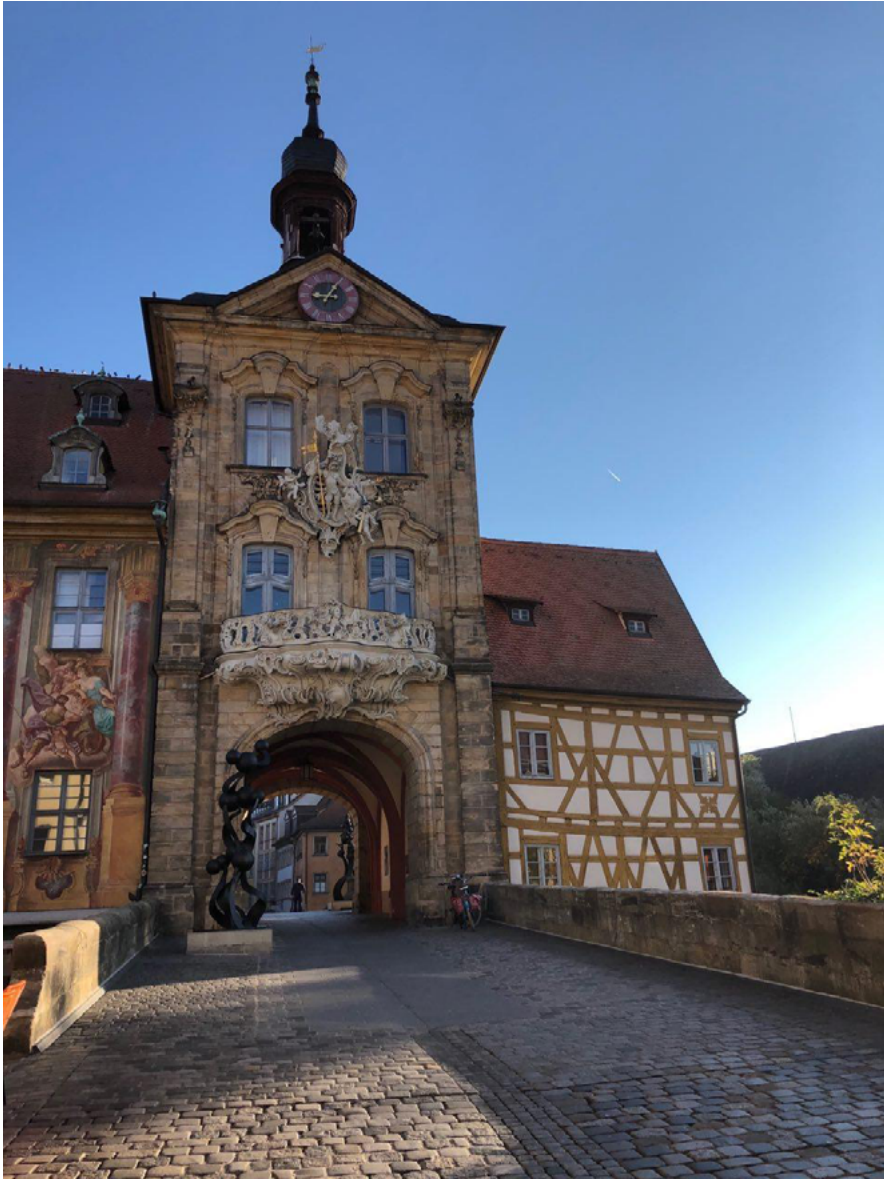
Fig. 2. Old Town Hall.

Influential components of the branding strategy are also symbolic resources of positioning Bamberg as a religious center. — Christian town. The Church was always important for this area. [Teacher 4] — it is especially interesting for tourists.