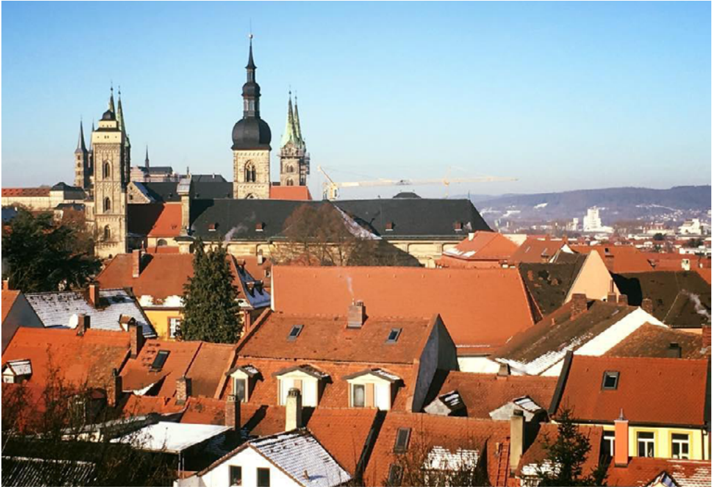
Fig. 3. Bamberg Cathedral.

faith, as experts say: still has a big influence on town inhabitants. [Teacher 1], and the Catholic faith still remains dominant.