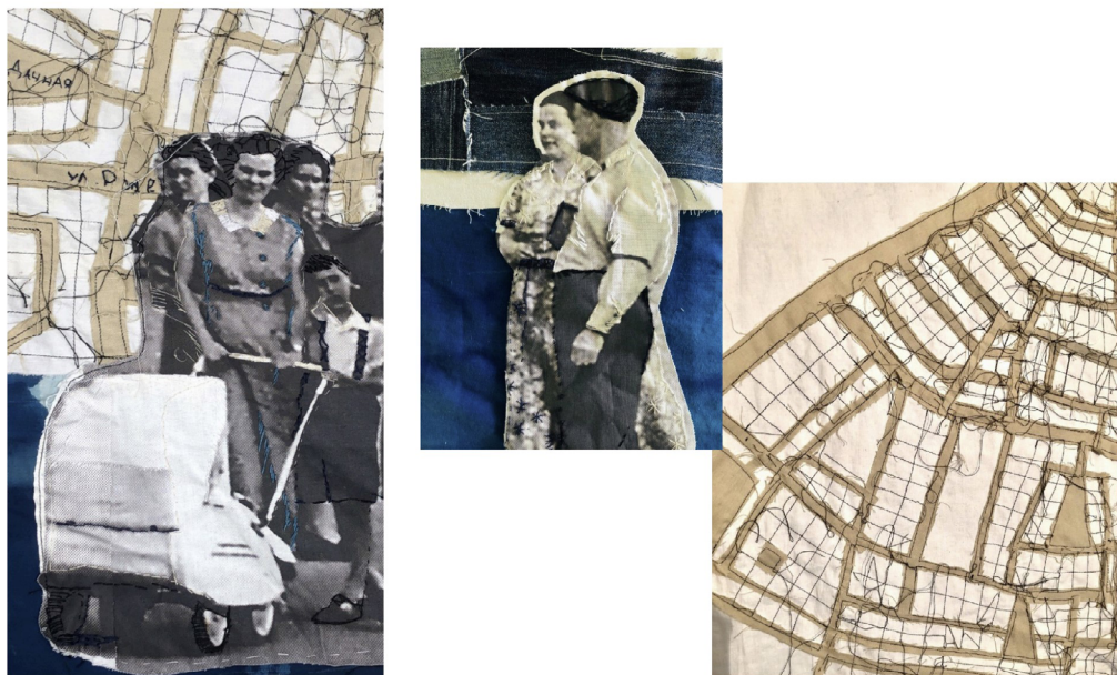
Рисунок 3. Детали текстильного коллажа Елены Шаргановой