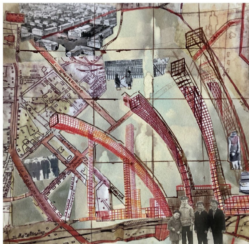
Рисунок 1. Коллажи на бумаге, послужившие основой для первых текстильных коллажей Елены Шаргановой. Бумага, коллаж, фотография, смешанная техника. 27 x 22 см и 27 x 26 см, 2023 год

По форме и содержанию эти полотна отчасти напоминают ментальные карты города [Линч, 1982]. Последние являются исследовательским инструментом в социальных науках и представляют собой изображение какой-либо местности, отражающее не только образ, но и социальный опыт информантов, сопряженный с физическим пространством [Веселкова, 2010: 6–7]. Однако «Лучезарный город» — это главным образом художественное высказывание, не подчиненное задачам социологического исследования города. Созданные в «Открытых студиях» коллажи не воспроизводят в строгом смысле историческую или современную карту Нелидова, впрочем, как и ментальные карты, которые отражают восприятие горожанами городской повседневности. Как отмечает Елена, это в первую очередь «проект о не случившемся будущем». Поэтому данное художественное высказывание может быть интерпретировано как одно из «пространств репрезентаций» в терминологии Анри Лефевра: это зона переживаемого, она «проникнута воображаемым и символикой и уходит корнями в историю — историю целого народа и каждого отдельного человека» [Лефевр, 2015: 55]. Образы и символы наполняют территорию и знания о ней, создавая пространство жителей, непосредственно использующих