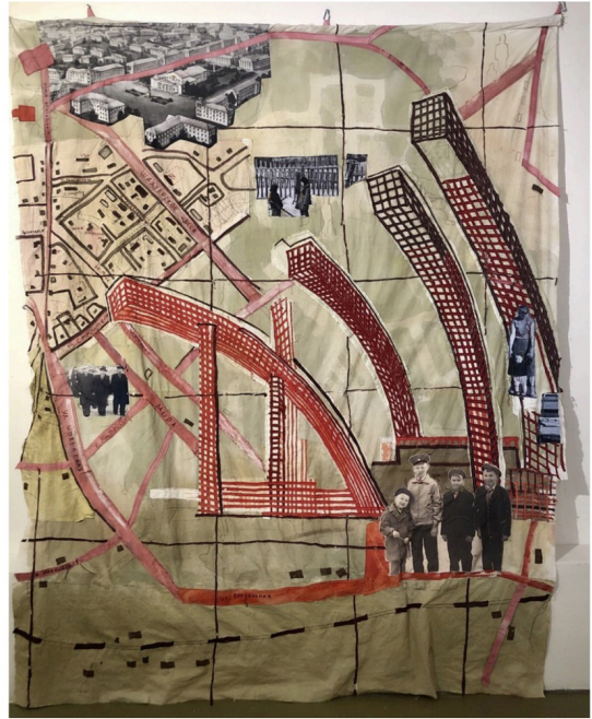
Рисунок 2. Текстильные коллажи из серии «Лучезарный город» Елены Шаргановой. Текстиль, ручное окрашивание ткани, коллаж, фотопечать на ткани, машинный шов, ручная вышивка. 250 x 190 см и 250 x 220 см, 2023 год