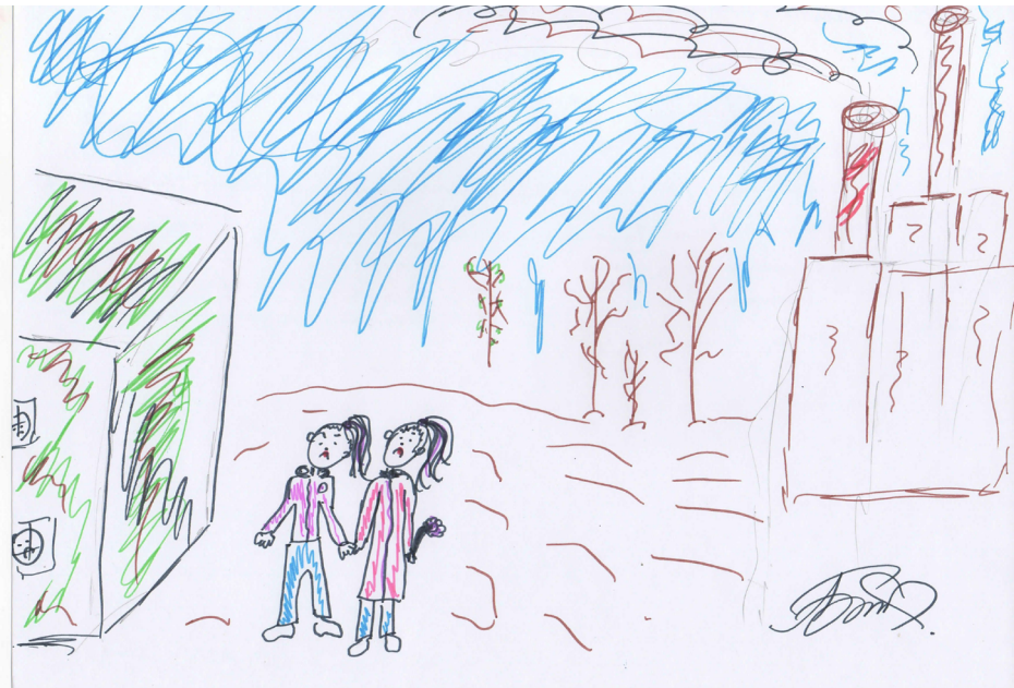
Рисунок 3. Серов на ментальной карте 11-классницы (СрЖШ1/11)

Если решение этой девушки заключается в том, чтобы убрать селитьбу, то ее ровесник из другой школы предлагает еще более радикальный вариант — «снести заводы»: