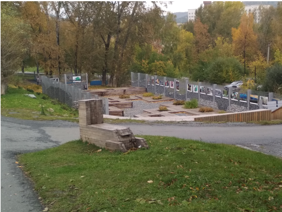
Рисунок 4. Арт-пространство «Руина» в Сатке. Сентябрь 2019

«Руина» — так называется открытое арт-пространство неподалеку от Дворца культуры в Сатке, созданное в 2017 году на месте снесенного дома (рис. 4). «Руину» придумали в рамках архитектурного фестиваля «Моя Сатка» и используют для уличных фотовыставок. Как таковых руин здесь уже нет, так что этот пример можно считать переходным между типами «креатива на руинах» и «креатива без руин».