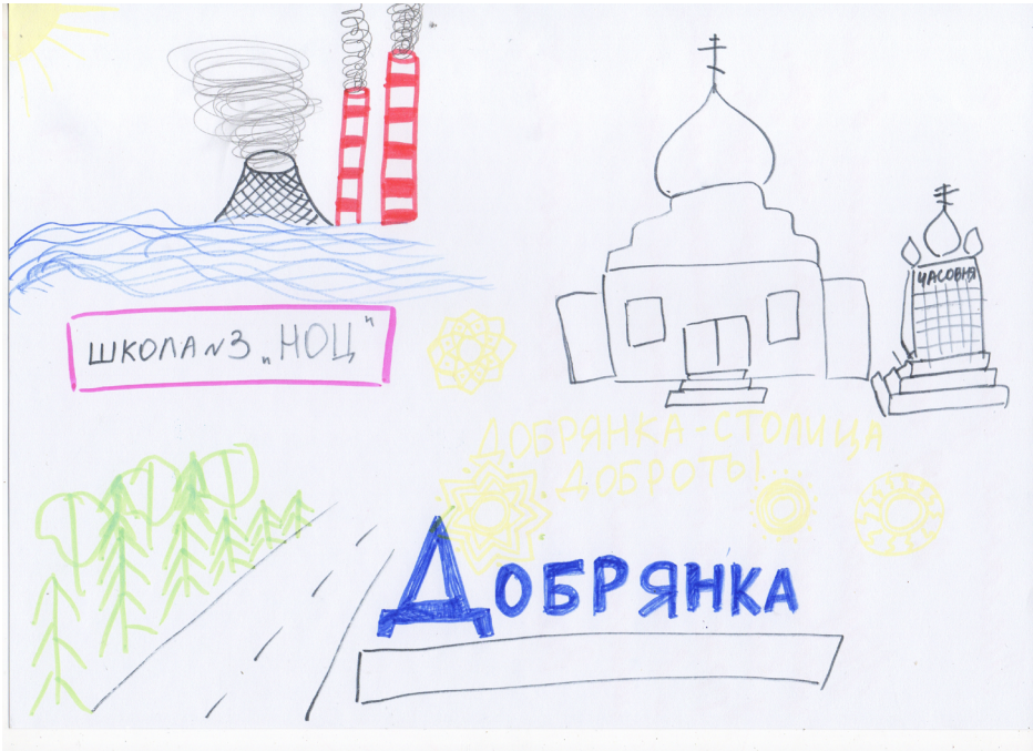
Рисунок 2. ГЭС на ментальной карте Добрянки (Д6Ж17)