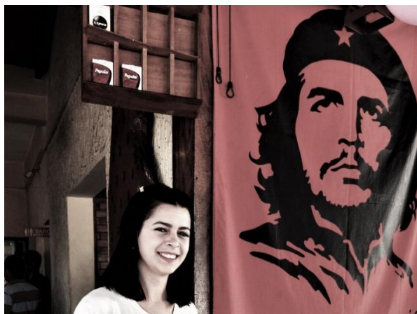
Рисунок 2. Фото.

Если кадр ограничить лицом девушки, то почти полное отсутствие социального контекста открывает безбрежный простор для домысливания. Лишь представления о расах ставят предел этому полету фантазии. Эта девушка могла жить где угодно и когда угодно, и только наличие фотокамеры ограничивает исторические рамки. Такой снимок не может быть социологическим документом.