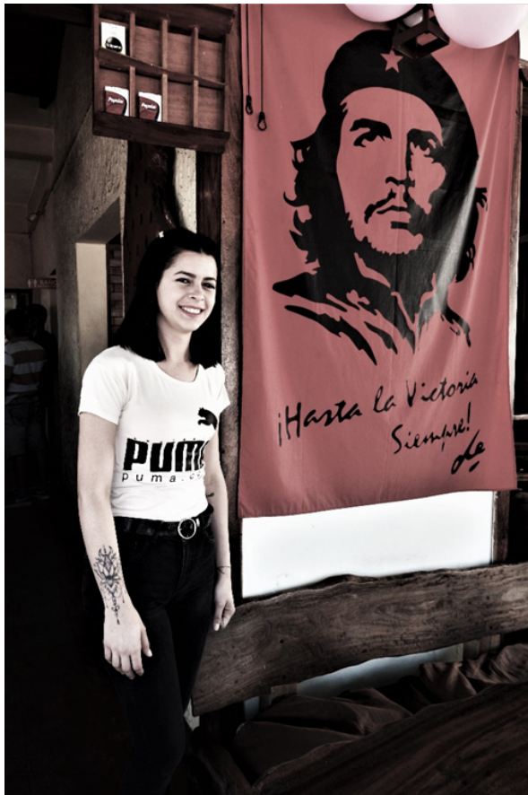
Рисунок 3. Фото.

Куба на протяжении длительного исторического периода (начиная с 1959 года) была форпостом прогрессирующей мировой социалистической революции, противостоящей мировому империализму во главе с США. Символом революционной романтики все эти годы был Че Гевара, сражавшийся за дело революции не только на Кубе, но и в других странах Латинской Америки и Африки. Многие тысячи кубинцев следовали его примеру и погибали на фронтах этой революции вдали от дома.