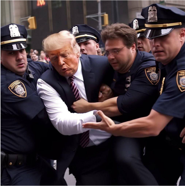
Рисунок 1. Фото. В 2023 г. бывшего президента США в разных штатах стали привлекать к уголовной ответственности по различным статьям. И еще до его задержания в интернете стали распространяться сфабрикованные фотографии его будущего задержания и сопротивления полиции. В силу очевидности фальшивки она приобрела статус шутки.

воззрений на общество, которым соответствовали бы выбор темы, композиция снимка, способ кадрирования, <...> оперирование глубиной резкости (фокусировка на том, что важно) и другие композиционные или технические меры» [Штомпка, 2007].