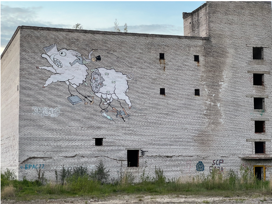
Рисунок 9. Изображение уцелевшего здания.