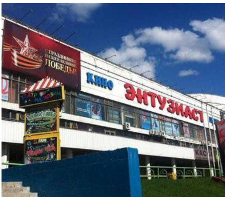
Рисунок 1. Кинотеатр «Энтузиаст».

Кинотеатр «Энтузиаст» располагается в парке «Вешняки» и долгое время был на пути по одному из моих рутинных маршрутов (Рис. 1). То, что регулярно попадает на глаза, рано или поздно вызывает исследовательский интерес. На примере руины кинотеатра «Энтузиаст» я поделюсь своим опытом, как обыденные наблюдения трансформируются в социологические.