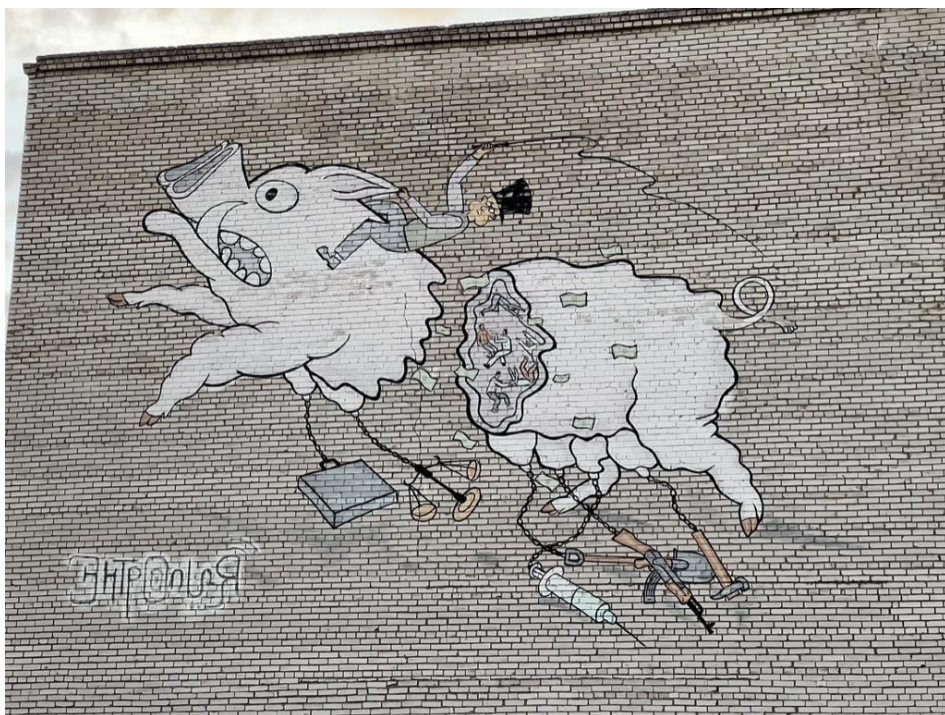
Рисунок 6. Граффити. Изображение, подписанное анонимными художниками. Возможно, автор (индивид, группа) — «Энтропия».

Руина в Ольгино размечена граффити как в виде больших композиций, так и в виде небольших надписей, понятных только посвященным. Обращает на себя внимание карикатурный образ капиталиста-всадника верхом на кабане, снаряженного различными предметами-символами: игла, оружие, деньги, орудия труда, весы (Рис. 6).