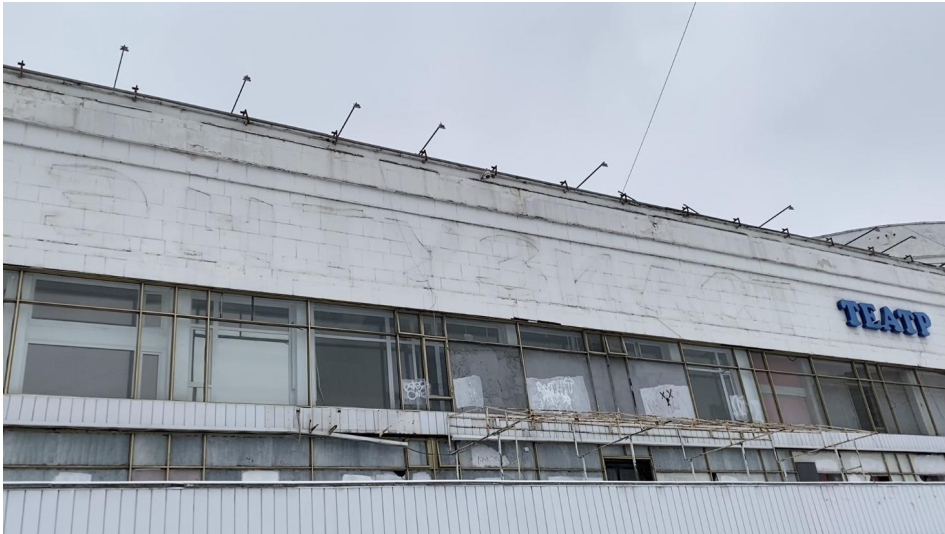
Рисунок 4. Кинотеатр «Энтузиаст». Декабрь 2022 года.

Таким кинотеатр мы видим сегодня. Буквы в названии «Энтузиаст» отпали (или были намеренно сняты) с фасада, остались лишь их нечеткие очертания: название можно прочитать, только внимательно присмотревшись (см. Рис. 4).