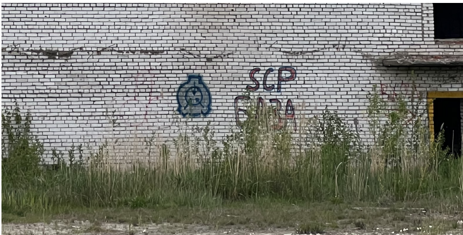
Рисунок 7. Граффити. Логотип вымышленной организации.

Вдохновляясь образами руин, представители различных субкультур стремятся переосмыслить отношение людей к миру и предостеречь от использования опасных технологий. Например, в руинах Ольгино мы обнаружили знак «SCP база» (Рис. 7). SCP — это международная вымышленная организация («Обезопасить. Удержать. Защитить, или же Особые условия содержания») [Roca, 2021: 29]. Название структура получила в честь одноименной интернет-истории про тайное общество, защищающее некий опасный для обывателей объект. Согласно легенде проекта, Фонд защищает рядовых граждан, изучает подозрительные объекты, высылая для ознакомления с ними мобильные оперативные группы, и затем создает инструкции для их безопасного использования. Под объектами Фонда обозначаются аномалии реального мира, включая одушевленные и неодушевленные объекты, которые затем переводятся в виде текстовой заметки в крупную базу данных. В реальном мире объекты не представляют никакой угрозы, но с помощью цифровых технологий люди создают истории, которые должны напугать других, и таким образом это становится частью городского фольклора. Данный проект пользуется популярностью у пользователей со всего мира, которые могут поучаствовать в проекте, если их статья пройдет модерацию. Так как на стене здания в военном городке указано, что данная территория является объектом базы SCP, следовательно, о данной руине сложена городская легенда и распространена в сообществе тех, кто вовлечен в проект SCP.