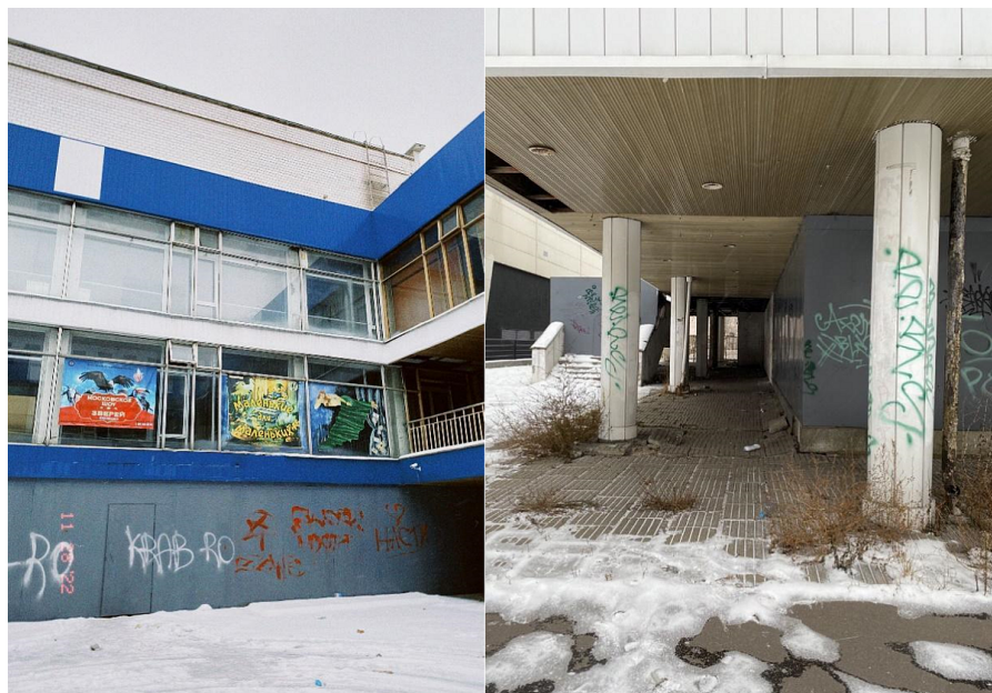
Рисунок 5. Кинотеатр «Энтузиаст». Детали. Декабрь 2022.

Это наблюдение кажется метафорой общего впечатления от самой руины: несмотря на относительную «новизну», она уже не мыслится локальными жителями как функционирующее здание, ее эфемерное присутствие остается разве что в подсознании [Каледина 2021; Рудь 2019]. Плитка вокруг кинотеатра сместилась — где-то провалилась, где-то вздулась, наружу прорвалась трава (Рис. 5). По Зиммелю, разрушение совершается природой, но оно есть следствие запущения человеком [Зиммель, 1996].