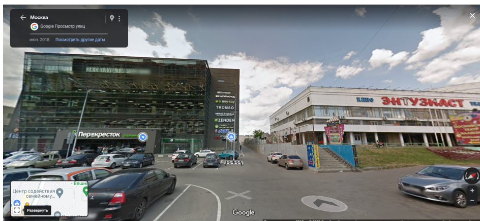
Рисунок 3. ТЦ «Вешняки», расположенный слева от кинотеатра, по состоянию на июнь 2018 года.

Отмечу, что здание заброшенного кинотеатра, с одной стороны, должно было бы резко выделяться среди других своей беспризорностью: слева от него располагается остекленный торговый центр (в прошлом — типовой блочный универмаг, построенный в 1985 году, см. Рис. 3), справа — совсем новый футуристический скейтпарк и ухоженная аллея.