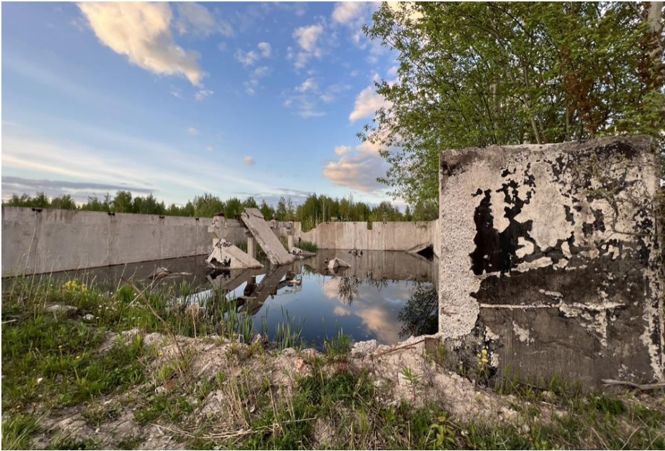
Рисунок 8. Пруд на месте наблюдения (руины в «Ольгино»).