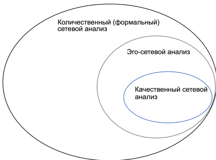
Рисунок 3. Методологические подходы в сетевом исследовании по Фузе и Мютцель.

Исходя из разделения Фузе и Мютцель [Fuhse, Mützel, 2011], сетевой анализ как изначально анализ структур является доминирующим в сетевых исследованиях. Помимо формального количественного сетевого анализа, есть подгруппа эго-сетевого анализа, внутри которого находится блок качественных сетевых исследований, что составляет «русскую матрешку» (Рис. 3). На основе теоретических оснований сетевого подхода в социологии можно выделить классические работы в сетевом анализе, которые можно отнести в целом ко всем сетевым исследованиям — это «библия» сетевого анализа Вассермана и Фауст [Wasserman, Faust, 1994], работы Грановеттера [Granovetter, 1973], Фримана [Freeman, 2004], Эмирбайера и Гудвина [Emirbayer, Goodwin, 1994]. К теоретическим основаниям эго-сетевого подхода авторы относят исследования сообществ [Warner, 1941; Wellman, 2005; Wellman, 2018] и исследования социального капитала [Granovetter, 1985; Coleman, 1988; Burt, 1997; Portes, 1998; Portes, 2000]. По мнению авторов, качественный подход в сетевом исследовании ссылается на классические социологические труды Зиммеля, Вебера, Элиаса [Elias, 1978] и Мида [Mead, 1967], а также интеракционистский подход к структуре [Fine, Kleinman, 1983], реляционную социологию Уайта и акторно-сетевую теорию.