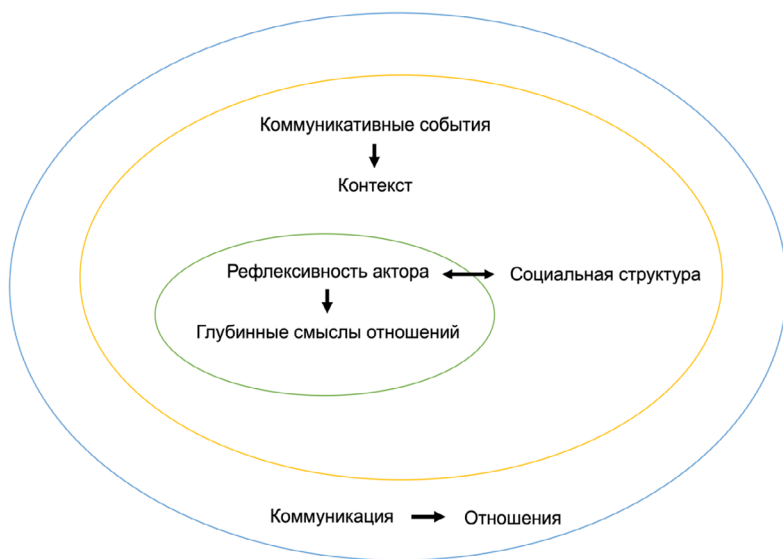
Рисунок 2. Дополненная аналитическая схема изучения глубинных смыслов отношений.

На мой взгляд, в аналитическую схему может быть добавлен категорийный компонент контекста отношений, способный обобщать исходную коммуникацию в единую форму. В свою очередь, рефлексивные индивиды обозначают смыслы отношений исходя из контекста этих отношений, заданных на основе коммуникационных событий и реляционных ожиданий. Также немаловажный элемент выявления глубинных смыслов отношений — рефлексивность актора. Рефлексивность понимается как способность индивида осознавать социальные отношения, наделять их эмоциями, личными историями и обобщать в сконструированный паттерн. Можно предложить дополнить аналитическую схему понятием социальной структуры в понимании Гидденса в теории структуризации, где социальная структура поддерживается через действие актора, а действие приобретает смысл только в контексте структуры [Giddens, 1984]. Рефлексирующий актор своими действиями формирует и воспроизводит социальную структуру , а также он способен изменить структуру, поэтому социальная структура и отношения в ней изучаются в динамике. Отношения между акторами рассматриваются согласно структурирующим принципам Гидденса — сигнификации, легитимации и власти, то есть между акторами всегда формируется иерархия [Giddens, 1984]. Аналитическая схема изучения глубинных смыслов отношений, дополненная вышеупомянутыми терминами, изображена на Рисунке 2.