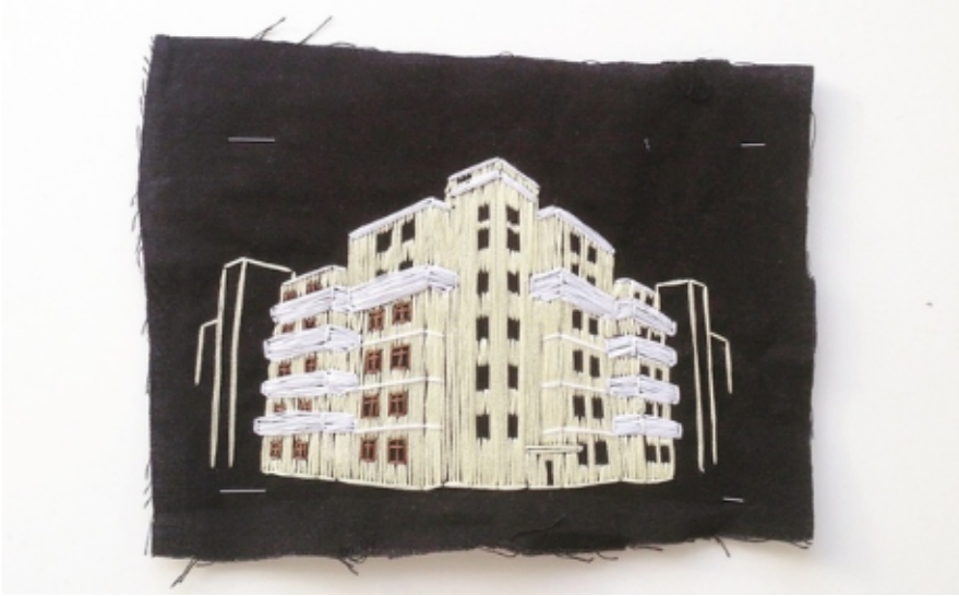
Рисунок 4. Вышивка, изображающая дом Хавско-Шаболовского жилмассива ( https://vk.com/wall40985_5962 )

Другой вариант творческого осмысления — вышивка в виде одного из зданий Хавско-Шаболовского жилмассива.