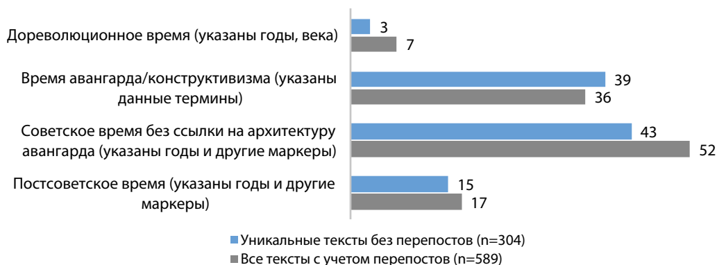
Рисунок 1. Частота упоминаний периодов времени в нарративах о районе Шаболовки

Рассмотрим распределение текстов в соответствии с задействованными в них масштабами темпоральной глубины памяти. В отношении Шаболовки целесообразно выделить следующие позиции темпорального масштаба: дореволюционный, советский и постсоветский периоды, а также время постройки зданий архитектуры советского авангарда.