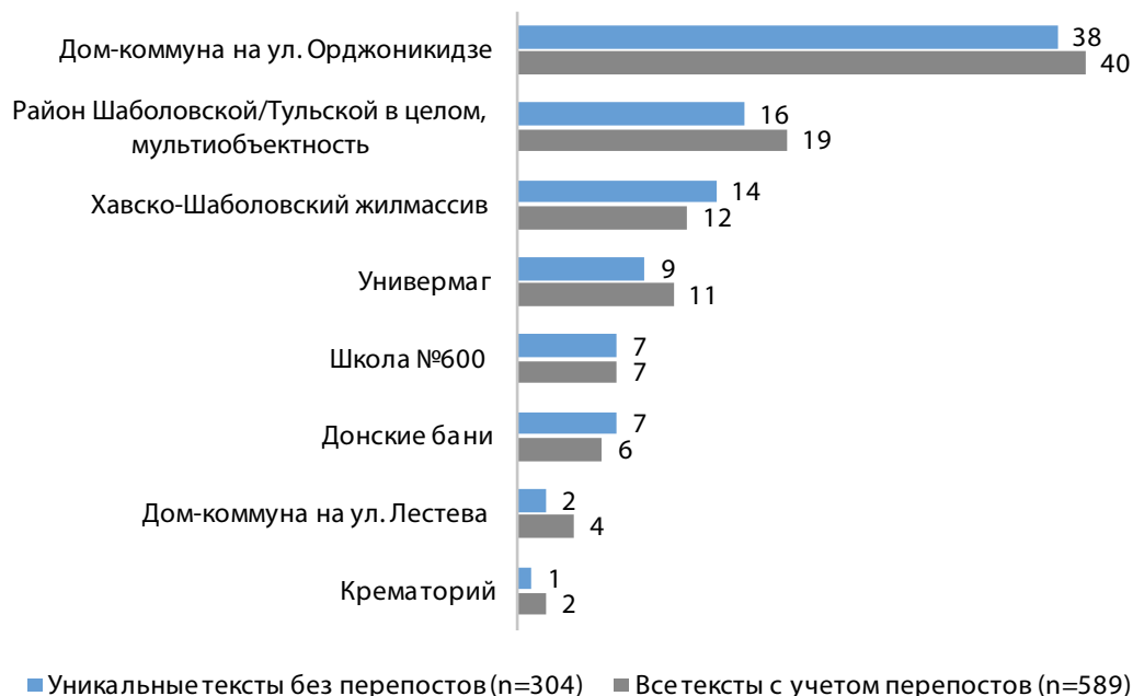
Рисунок 2. Объекты внимания в тексте в нарративах о районе Шаболовки

«сохранения и восстановления», процесс воспоминания представляет собой «длящийся процесс передачи», где средства определяют получаемое сообщение (Олик, 2012: 53), свидетельствуют о характере коммуницируемой связи между прошлым и будущим.