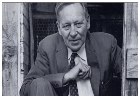
Фото 1. Британо-американский антрополог Грегори Бейтсон (1904–1980)

Идентификация «двойного послания» стала дополнительным средством понимания и терапии патологических отклонений в системе коммуникации. «Двойное послание» может провоцировать блокировку коммуникации, что влечет за собой серьезные последствия в области индивидуальных патологий.