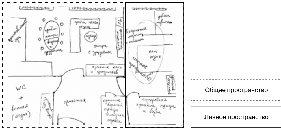
Рис. 1. Ментальная карта домашнего пространства: разграничение «общего» и «личного» пространств. Автор: ж., 26 лет, проживает в квартире одна

В целом пространство для работы участники исследования видят «отделенным» от зон для бытовых и досуговых дел, что видно на схемах желаемой организации пространства (см. рис. 1).