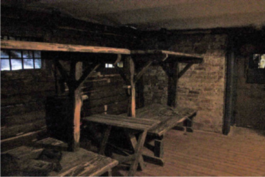
Рис. 4. Реконструкция барака в подвале музея. Фото автора, 11 февраля 2015 г.

Важным моментом относительно практик посетителей является чтение тематической литературы. Стоит отметить, что основная часть респондентов получила знания о системе ГУЛАГа преимущественно из художественной литературы, работ В. Шаламова и А. Солженицына, о чем информанты указывают в интервью: