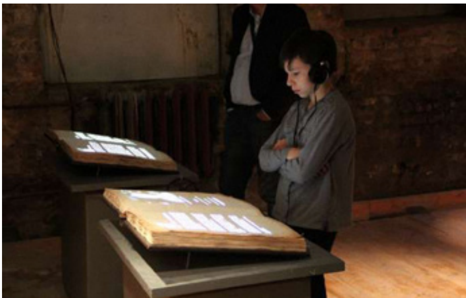
Рис.3. Посетители и «Живые книги Памяти» 12

Посетители музея словно стремятся прикоснуться к «живой истории», оказаться не просто на месте другого человека, но в другой реальности: