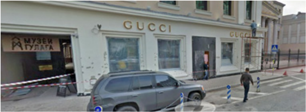
Рис. 1. Контекст пространства: рядом с музеем — дорогой магазин и здание Генеральной Прокуратуры 9

а вход находится в арке, как бы «скрывающей» музей от посторонних. При входе в музей посетитель наблюдает вышку часового, проходит «коридор», огороженный колючей проволокой, а в окнах висят плакаты, на которых размещены фотографии репрессированных.