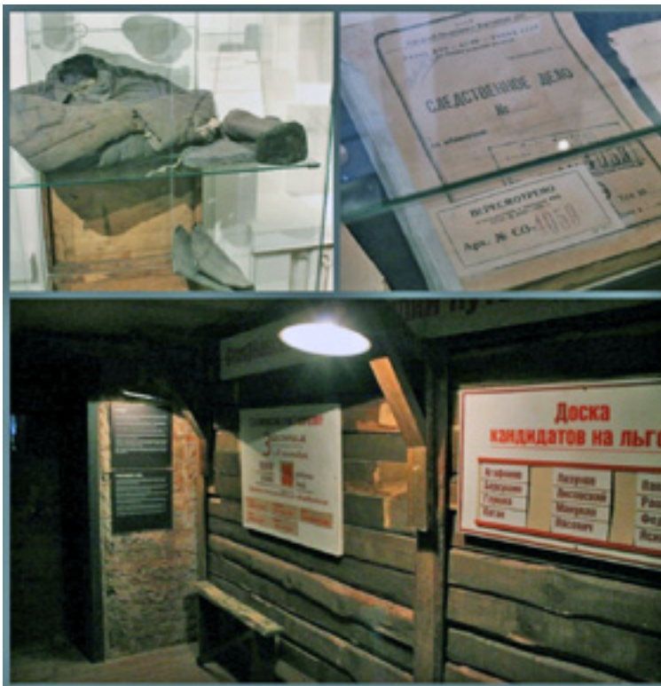
Рис. 2. Элементы экспозиции музея: личные вещи заключенного, архивные документы, реконструкция фрагмента барака. 11 февраля 2015 г.